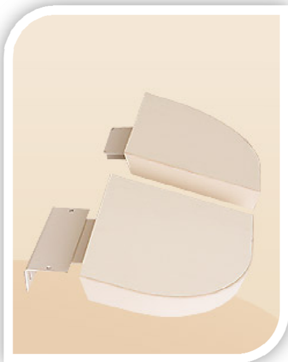
Комплект съемных подлокотников

ООО «РЕАЛДЕНТ» 394006, г. Воронеж, ул. Красноармейская, д.60.